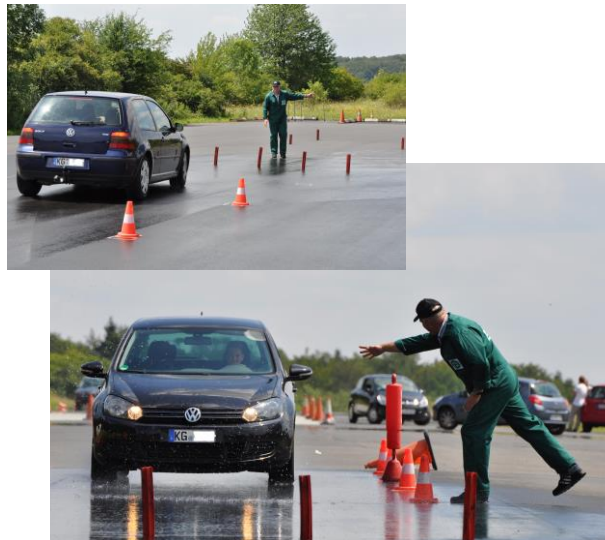
Gefahrbremung und Ausweichen