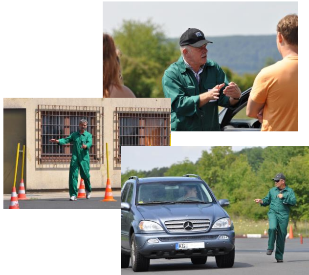
Praktische Tipps und Hilfen gehören auch dazu