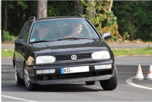
Kurvenfahren mit Köpfchen