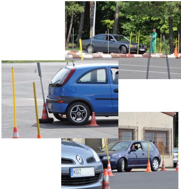
Fahren auf Genauigkeit